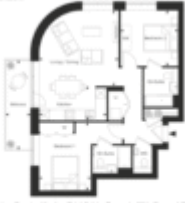
The Green Quarter, Quarter Yard - Brickfields, Property 281, Second Floor